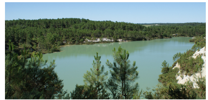
Site de Touvérac