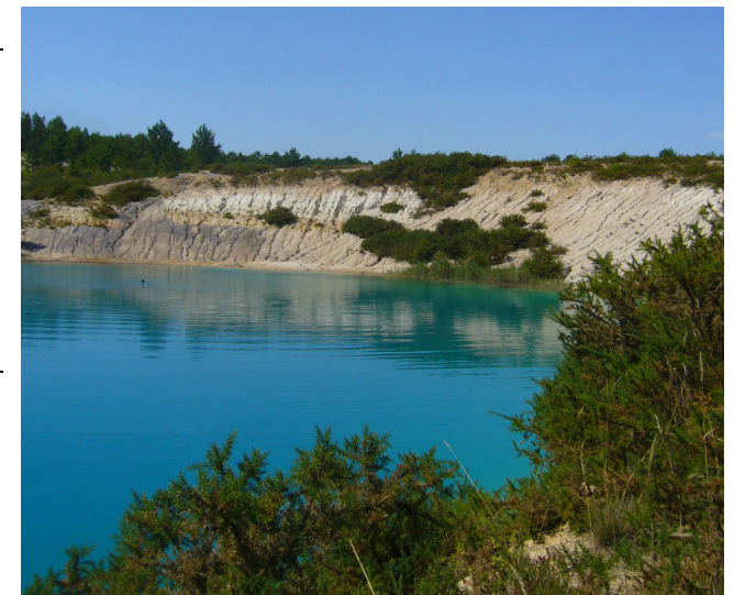
Terriers des renards